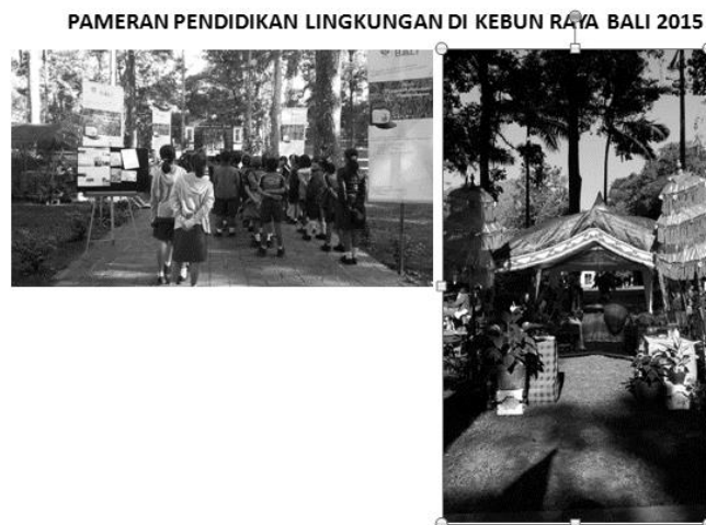
Gambar 4. Pameran Pendidikan Lingkungan Di Kebun Raya “Eka Karya” Bali 2015 Bertajuk “Lets Learn and Play in Nature”

Kebun Raya “Eka Karya” Bali menyelenggarakan pameran pendidikan lingkungan hidup pada tanggal 18 Mei s/d 16 Juni 2015 dengan tema adalah “Lets Learn and Play in Nature” yang bertujuan untuk mengenalkan program tersebut kepada publik sekaligus sebagai strategi awareness Kebun Raya “Eka Karya” Bali. Pameran pendidikan lingkungan hidup diselenggarakan bertepatan dengan momentum liburan sekolah, karena pada bulan Mei-Juni adalah puncak kunjungan siswa di Kebun Raya “Eka Karya” Bali.