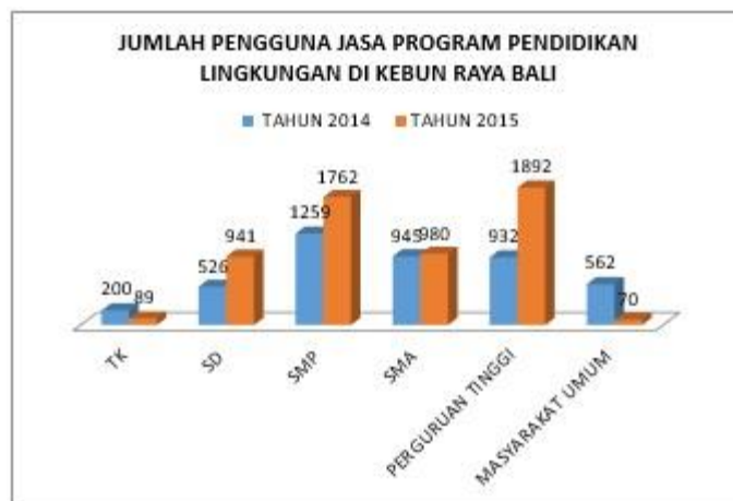
Gambar 7. Jumlah Pengguna Jasa Pendidikan Lingkungan Hidup Kebun Raya “Eka Karya” Bali Mengalami Peningkatan Signifikan Dari Tahun 2014 dan 2015

Karya” Bali. Sebanyak 76,9% sekolah yang telah mengikuti workshop program pendidikan lingkungan hidup di Kebun Raya “Eka Karya” Bali mengambil keputusan untuk berkunjung secara berkelanjutan ke Kebun Raya “Eka Karya” Bali dengan mengajak siswanya mendalami pengetahuan pendidikan lingkungan hidup.