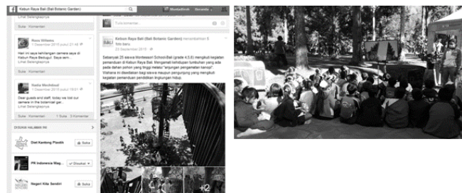
Gambar 3. Promosi Program Pendidikan Lingkungan Kebun Raya “Eka Karya” Bali Melalui Media Sosial dan Media Audio Visual