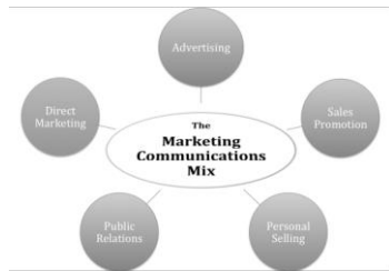
Gambar 1. Marketing Communications Mix

tersebut saling terkait untuk mendukung pencapaian output dan outcome komunikasi seperti yang diharapkan oleh Kebun Raya Bali.