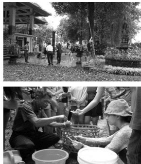
Gambar 6. Pemberian Layanan Program Pendidikan Lingkungan Gratis Bagi Para Siswa Sebagai CSR Kebun Raya “Eka Karya” Bali Tahun 2015