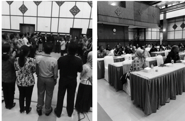
Gambar 5. Penyelenggaraan Workshop Pendidikan Lingkungan Bagi Stakeholder Kebun Raya “Eka Karya” Bali 2015