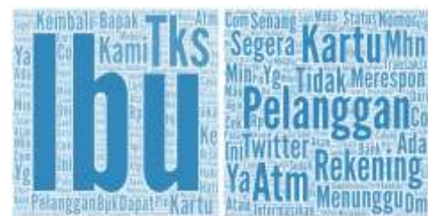
Gambar 3. Pembicaraan Konsumen di Twitter yang Diolah Ke Dalam WordCloud.

Dalam waktu 24 jam, rata-rata tweet yang memuat salah satu dari akun perbankan @haloBCA, @JeniusConnect, @BNI, @BankMandiri, @kontakBRI mencapai 49 tweet per jam, dengan tingkat impression (jangkauan) mencapai 41 ribu per jam. Sementara itu, tingkat rata-rata setiap tweet di retweet oleh akun lain tidak lebih dari 1 kali per tweet. Hal ini menunjukkan bahwa secara umum, tweet bukan berisi konten yang perlu disebarluaskan kembali. Data tingkat retweet rate yang rendah juga menunjukkan bahwa secara umum, tweet yang di-post oleh akun twitter baik akun perusahaan maupun akun konsumen lebih banyak bertujuan untuk melakukan interaksi secara dua arah.