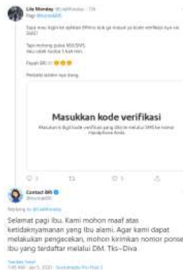
Gambar 5. Contoh Keluhan Yang Disampaikan Konsumen Melalui Twitter

Klasifikasi keluhan konsumen bisa diakibatkan 2 hal. Dari data yang ada, keluhan konsumen bisa hadir apabila konsumen kurang merasa puas terhadap pertanyaan mereka. Kedua, konsumen menganggap fitur yang digunakan dari salah satu produk perbankan kurang sesuai.