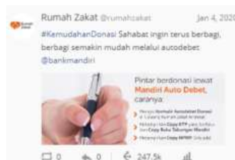
Gambar 7. Contoh Kolaborasi Eksternal di Twitter ( sumber: dok. riset/ hasil, 2020 ).

klasifikasi kolaborasi. Dalam hal ini, terdapat dua jenis kolaborasi, yaitu secara internal di mana dalam 1 perusahaan terdapat lebih dari 1 akun twitter yang saling menanggapi sesuai dengan konten yang disampaikan oleh konsumen. Misalnya, pada Bank Mandiri, terdapat 2 akun utama yang memiliki tingkat interaksi tinggi, yaitu @BankMandiri sebagai akun yang berfungsi untuk meningkatkan citra dan brand image perusahaan, serta @MandiriCare yang berfungsi sebagai saluran layanan pelanggan di twitter. Hal serupa juga didapati di bank lain, seperti BRI, dan BNI.