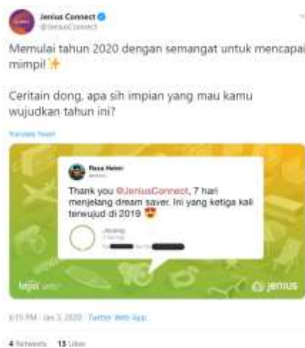
Gambar 6. Contoh Konten Edukasi Yang Dirilis Oleh Perusahaan Perbankan Melalui Twitter.

Konten pesan informatif dalam hal ini terkait dengan konten branding yang menginformasikan sesuatu terkait dengan perusahaan melalui twitter. Dalam hal ini, konten informatif dirilis secara reguler oleh akun perbankan setidaknya 3 - 5 konten per hari.