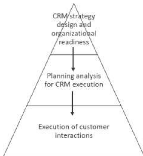
Gambar 1. CRM flow model (sumber: Hansotia, 2002).

Dari alur bagan yang digambarkan oleh Hansotia (2002), tahapan utama dalam sebuah proses CRM meliputi CRM strategy design and organisational readiness , Planning and analysis for CRM execution , dan Execution of customer interactions . Pada tahapan pertama, strategi dan kesiapan organisasi dalam perusahaan merupakan titik awal dalam sebuah fase manajemen hubungan dengan konsumen.