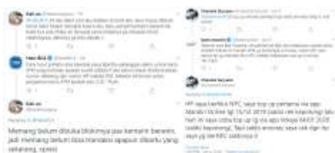
Gambar 4. Sampel Interaksi Antara Konsumen Dengan Perusahaan Perbankan di Twitter

Tidak hanya itu, pertanyaan konsumen juga berkaitan dengan beberapa kendala teknis yang mereka alami ketika menggunakan produk perbankan seperti internet banking, mobile payment, ATM, kendala rekening, maupun transaksi offline yang dilakukan oleh konsumen. Dari data yang dianalisis, dapat diketahui bahwa twitter menjadi media yang pertama kali dijadikan alternatif untuk menghubungi perbankan oleh konsumen sebagai langkah awal untuk mengajukan suatu pertanyaan.